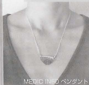
MEDIC INFO ペンダント