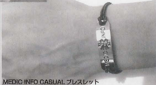
MEDIC INFO CASUAL ブレスレット